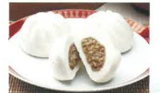
Formeinheit für chinesische Dampfnudeln