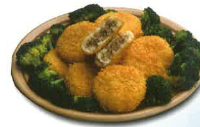
Krokette mit Fleischfüllung