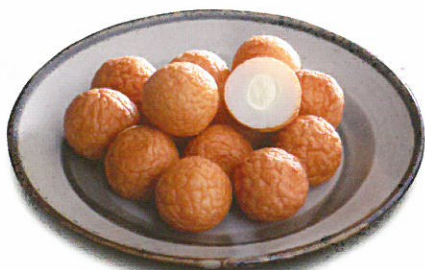
Fischbällchen mit Mayonnaise