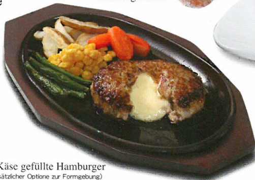
Mit Käse gefüllte Hamburger (mit zusätzlicher Optione zur Formgebung)