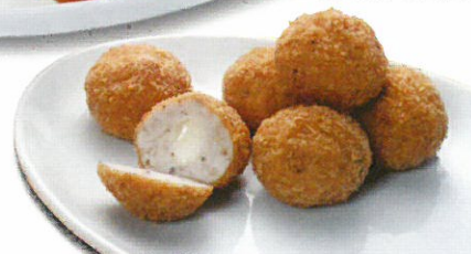
Mit Käse gefüllte Hühnerfleischbällchen