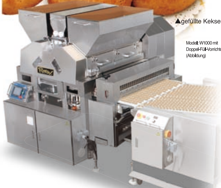
Modell: W1000 mit Doppel-Füll-Vorrichtung (Abbildung)

Ausgerüstet mit der neuesten Extrusions- und Portioniertechnik; realisiert in einer unglaublich kompakten Maschine.