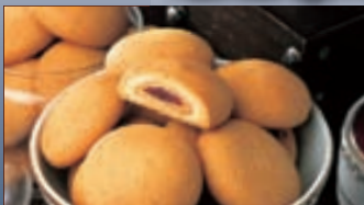
Doppelt gefüllter Keks